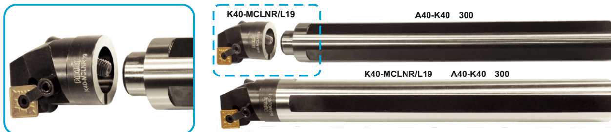
schemat montażu systemu / connection schema of the system / схема сборки системы

modułowy system noży tokarskich wytaczaków ze złączem z wymiennymi głowicami roboczymi w systemach: S, M, P-K. modular system of boring tools with connector with replaceable heads in systems: S, M, P-K. модульная система токарных расточных резцов с стыком со сменными рабочими головками система: S, M, P-K.